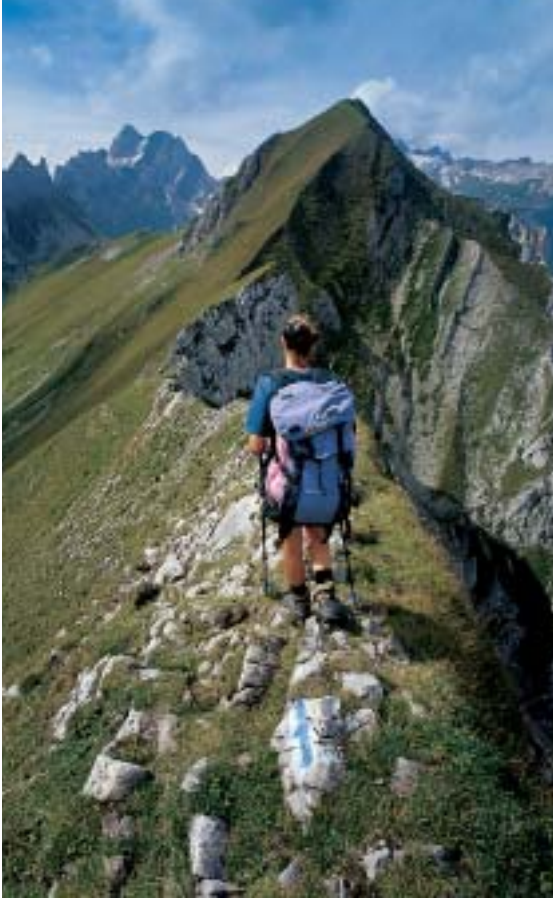
Die Marwees-Gratüberschreitung (Alpstein) ist mit Schwierigkeitsgrad T4 eine Alpinwanderung.