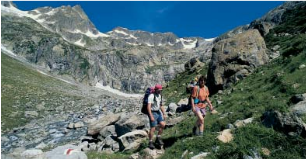
Beispiel für Schwierigkeitsgrad T2: Normalaufstieg Sustlihütte